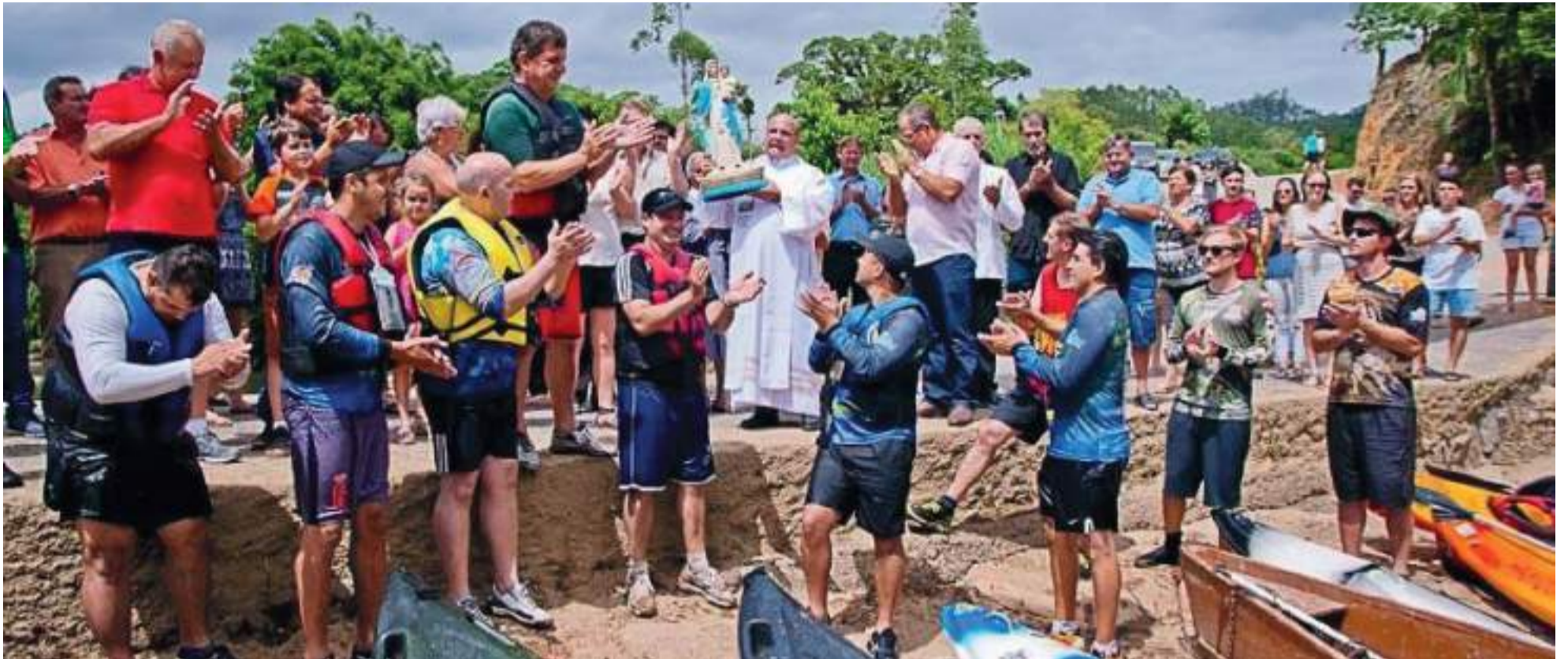
Ponte Baixa repete a tradição e imagem de Nossa Senhora dos Navegantes será trazida por caiaqueiros que descerão o Rio Braço do Norte