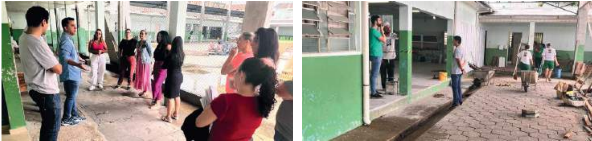
Escola Professor Antônio Rohden, que atende cerca de 1.200 alunos e conta com aproximadamente 100 funcionários, passa por reformas