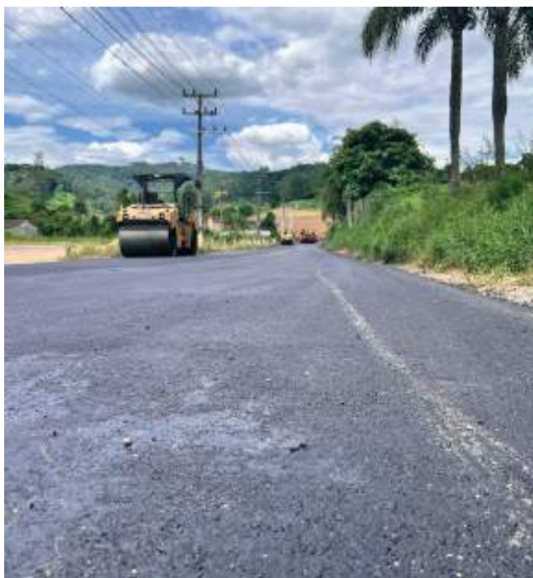
Ruas Newton Marcelino e Renato Bonetti ganham asfalto