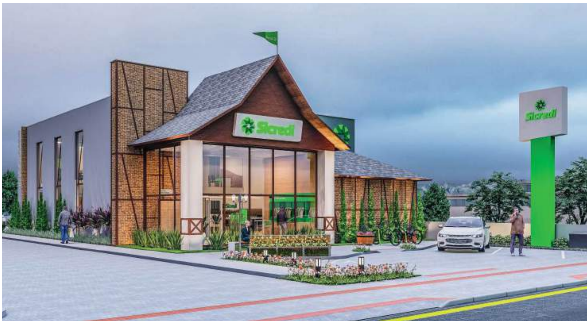
Projeto arquitetônico da nova agência foi inspirado nas raízes alemãs da cidade, utilizando a técnica construtiva enxaimel, trazida pelos imigrantes