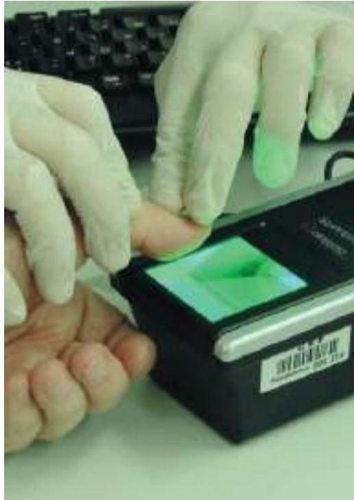
Cadastro biométrico é um dos serviços que serão disponibilizados na ação

Iniciativa busca garantir o acesso democrático e simplificado aos cidadãos.